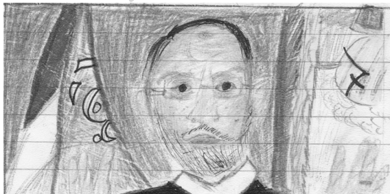
Mohamed Morsi

les juges au procès du chef des frères musulmans se récusent.