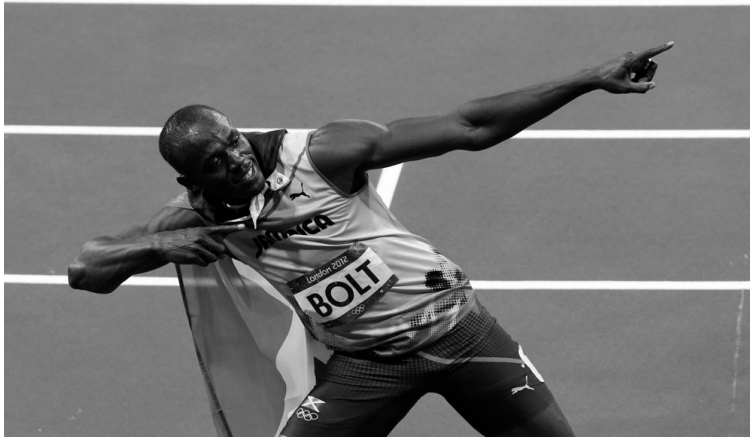
Usain Bolt et sa célèbre flèche

Si le premier est décédé, c'est à travers sa fille, Cedella, que les deux jamaïcains se rencontreront. En effet, c'est elle qui créera les tenues des athlètes jamaïcains aux prochains J.O.