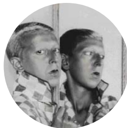
Claude Cahun, Autoportrait