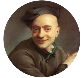
M.Q. de La Tour , Autoportrait dit « à l'index »