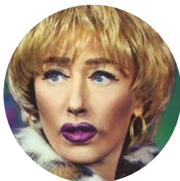
Cindy Sherman, Untitled Film Stills,