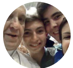
Même le pape François s'y est mis.