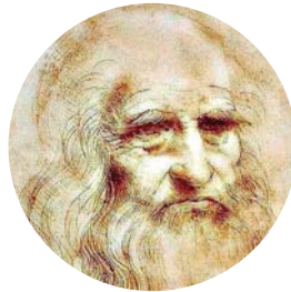
Léonard de Vinci Autoportrait