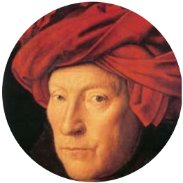
Jan van Eyck, L'homme au turban rouge, autoportrait présumé – détail