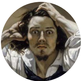
Gustave Courbet, Autoportrait