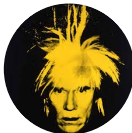
Andy Warhol Autoportrait