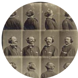
Nadar, Autoportrait tournant